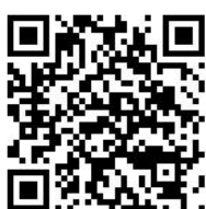
Форум «Карьера GO»