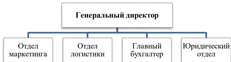
Рис. 2.1. Организационная структура ООО «Кластер»

Если речь идет о вопросе, связанном с рисунком, в тексте помещают ссылку либо в виде заключенного в круглые скобки выражения (Рис. 2.1), либо в виде специального оборота, например: как показано на рисунке 2.1.